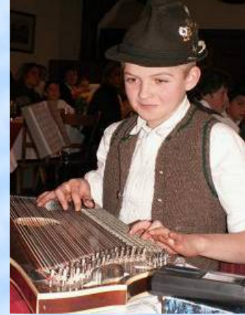
Ein "Eichnerischer vo' Jasberg" an der Zither

Am 13. November gab's unter dem Titel "Hoagascht für Klavier & Co" in der Klosterschänke zum ersten Mal für diese Zielgruppe ein gemütliches Zusammensein mit Musik für jugendliche Musikant/inn/en.