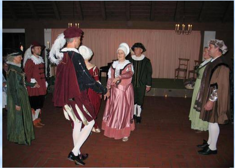
Tanzbeginn gemessenen Schrittes