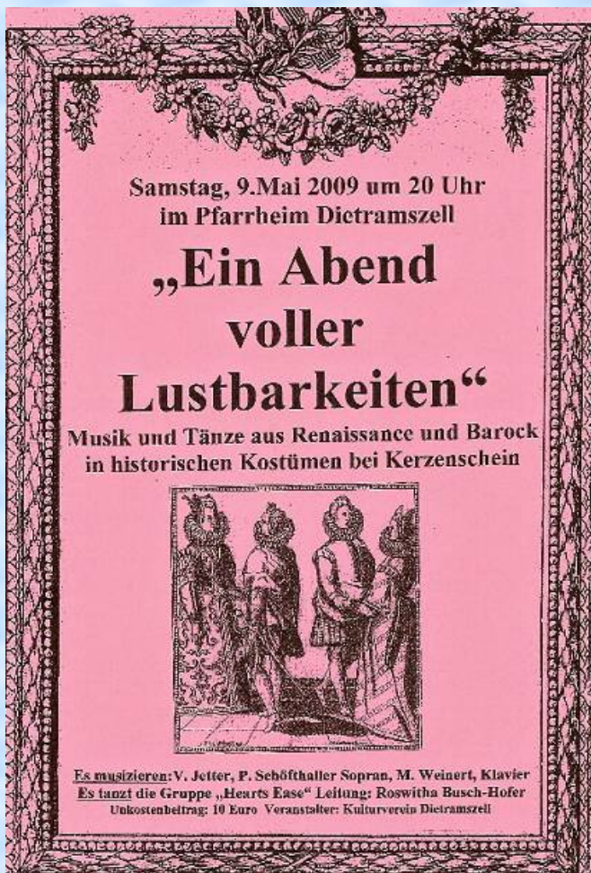
Bericht im Isar-Loisachboten vom 11.5.2009