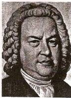
Johann Sebastian Bach