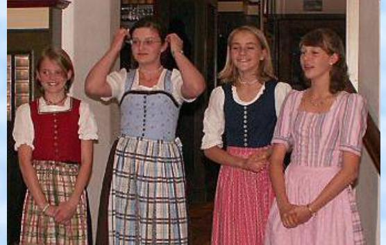
..... und vokal