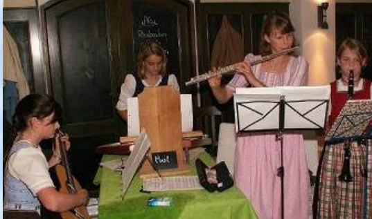
"De D'zeller Soatnblaser" - instrumental