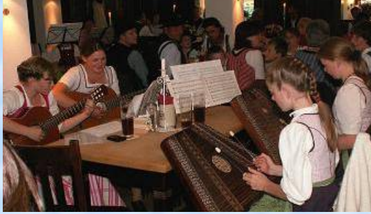
Die "Eichnerischen" von Jasberg