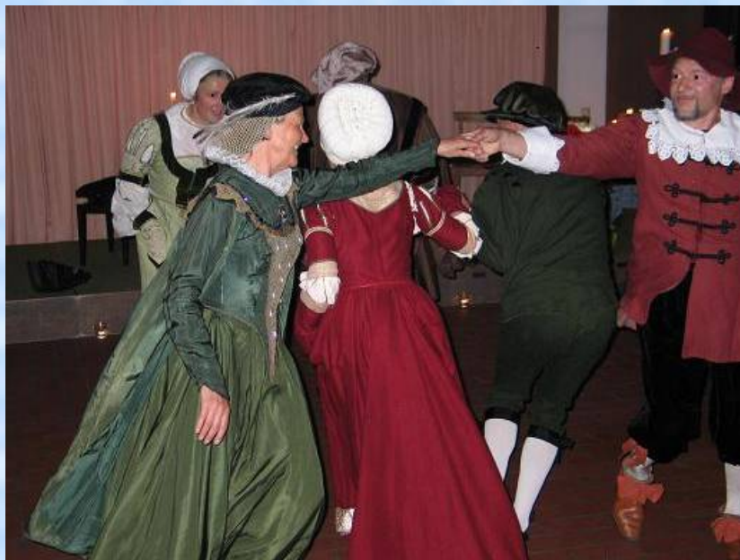
Temporeich und lustvoll