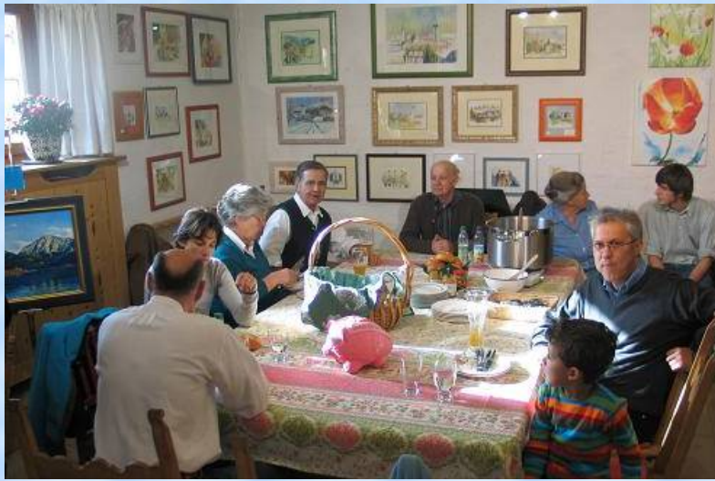
Richtig gemütlich gings zu beim Weißwurstessen am Sonntag-Mittag