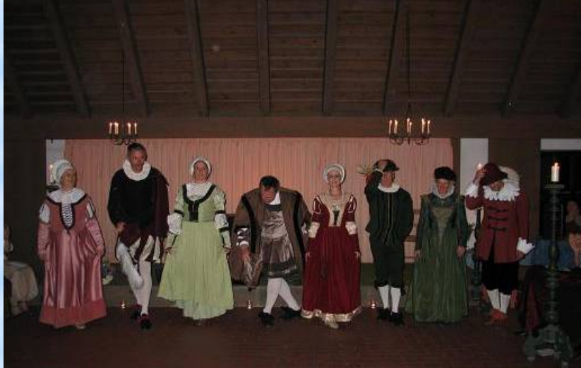
Referenz und Verabschiedung des Tanz-Ensembles