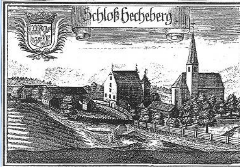
Ansicht von Hechenberg, Kupferstich von Michael Wening, 1701