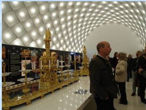
Im großen Haupt- und Prachtsaal der wahrhaft königlichen Ausstellung