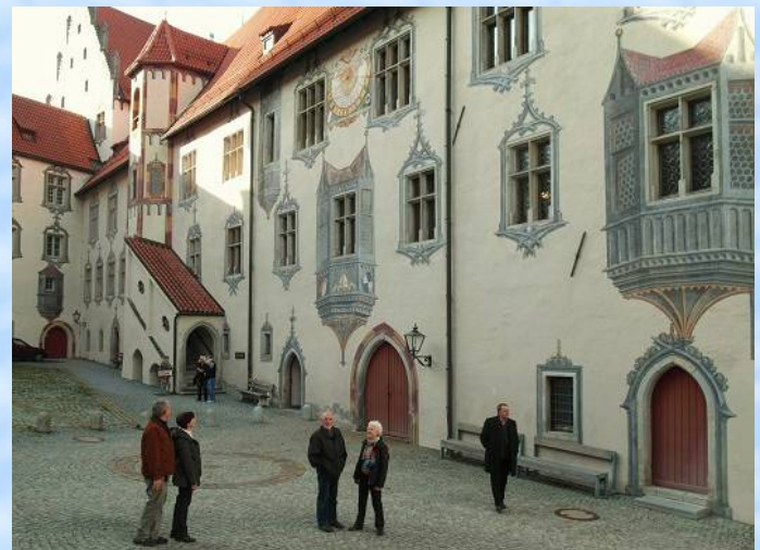
Im Burg-Innenhof des "Hohen Schlosses" Füssen mit der beeindruckenden Illusions-Architektur-Bemalung