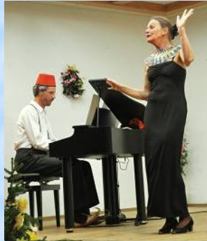
Ganz "pharaonisch": "In der Bar zum Krokodil" von Beda/Engel