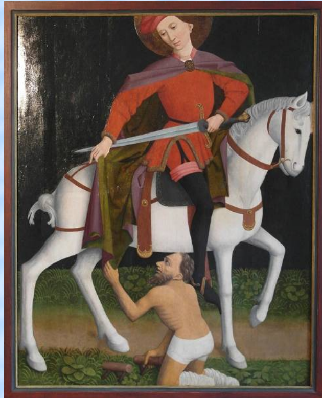
Das Tafelbild des Hl. Martin aus der Ulmer Schule des 15. Jh. würde auch Dietramszell gut anstehen.