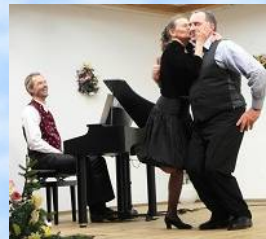
"Sag Schnucki zu mir" von Leo Fall