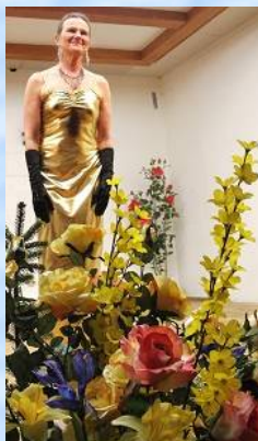
"Ich weiß nicht, zu wem ich gehöre" von Fr. Holländer