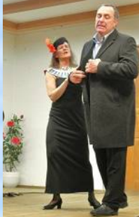
"Josef (Bilgeri), ach Josef; was bist du so keusch!" von Leo Fall