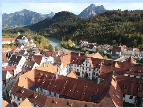
Überwältigender Blick vom "Fallturm" der Burg auf die Altstadt und St.Mang mit Lech und Säuling