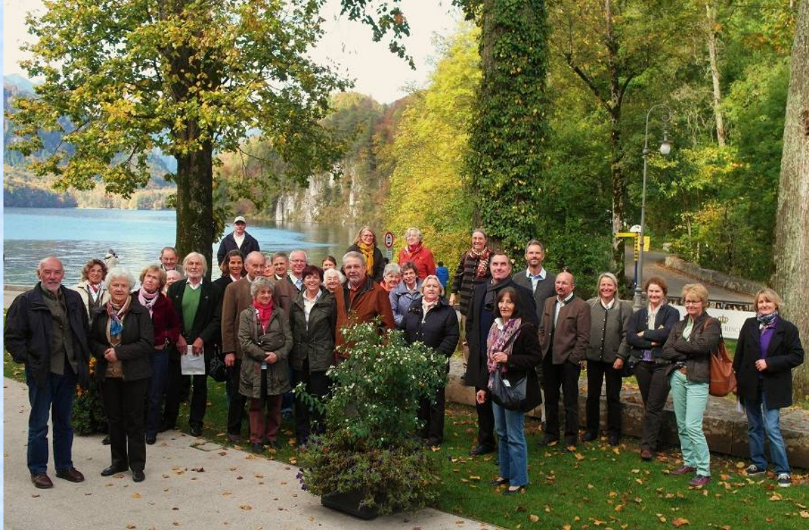
Die gemischte Gruppe Kulturinteressierter aus Dietramszell und Umgebung fand sich gutgelaunt in Hohenschwangau am Alpsee vor dem neuen Museum zum obligatorischen Gruppenbild zusammen.