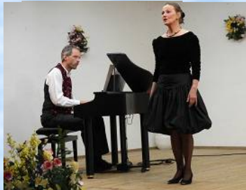
"So oder so ist das Leben; so oder so ist das Glück" von Theo Mackeben