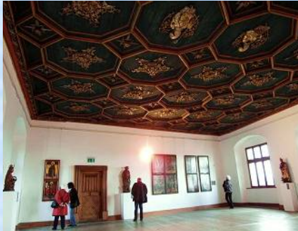
In der Galerie des Hohen Schlosses befindet sich eine umfangreiche und bedeutende Kunstsammlung, besonders der süddeutschen Gotik.