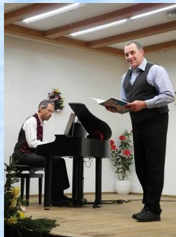
"Ich hab das Fräulein Helen baden gesehen" von F. Raymond