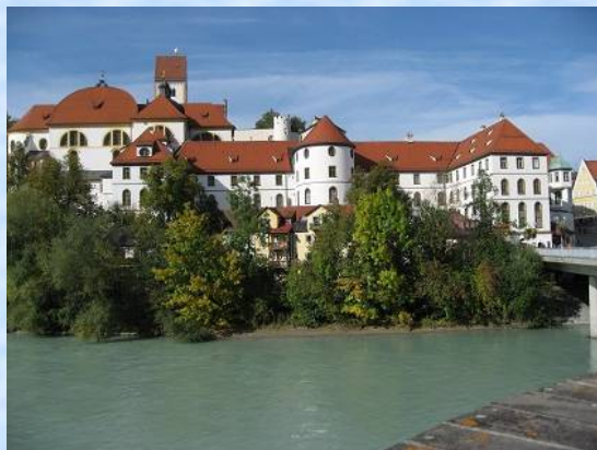
Über dem Lech: Füssen, St. Mang (Kirche und ehemaliges Benediktinerstift)