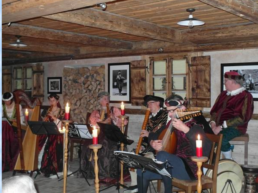
Die exzellenten Musiker/innen ziehen das Publikum mit virtuosem Spiel auf historischen Instrumenten in ihren Bann.