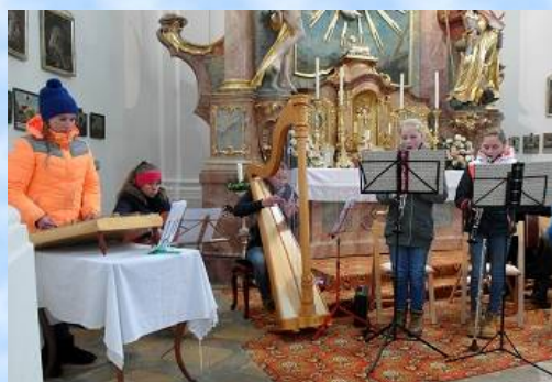
Eine neue junge Dietramszeller Hausmusik hat sich zusammengefunden in der Besetzung Hackbrett, Gitarre, Harfe und Klarinetten.