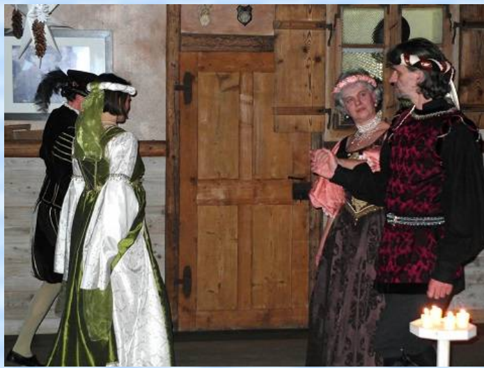
Höfische Tänze in prachtvollen Renaissance-Gewändern