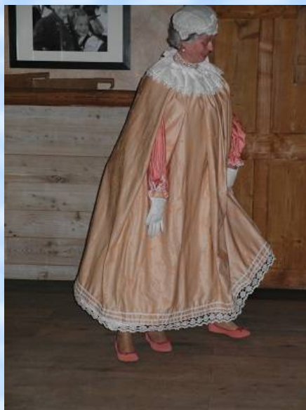
Der Tanz der dreibeinigen Dame - eine Weltsensation!

Texte: Ursula Rosche