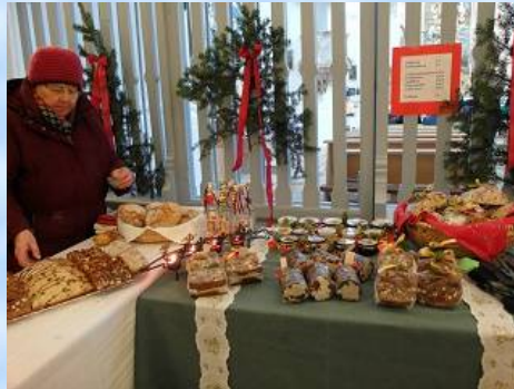
Ein reiches Angebot vorweihnachtlicher Köstlichkeiten