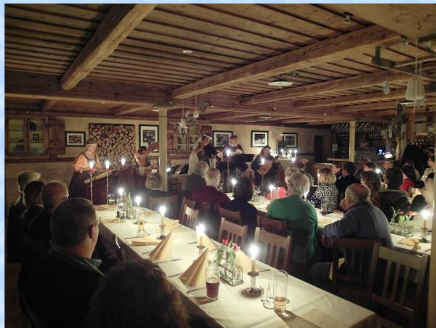
Warmes Kerzenlicht versetzt Künstler und Publikum zurück in die Zeit vor Erfindung der Glühbirne.

Tief emotionaler Gesang, virtuose Musiker, historische Instrumente, mitreißender Rhythmus, prachtvolle Gewänder, zeremonielle höfische Tanzfiguren ebenso wie schwungvoller Tanz auf drei Beinen, warmes Kerzenlicht anstatt kaltes elektrisches Licht... - Immer tiefer tauchte das Publikum ein in den Zauber der Musik und ließ sich auf eine Reise in längst vergangene Zeiten und an ferne Orte mitnehmen. Ebenso begeistert wie das Publikum zeigte sich auch die anwesende Presse, wie der Artikel in der Süddeutschen Zeitung vom 30.01.2017 bezeugt.